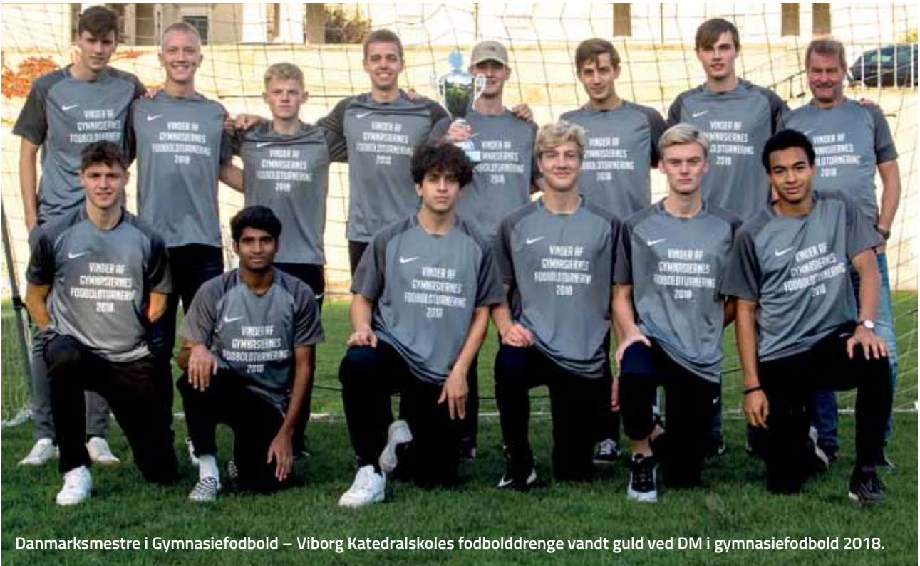
Danmarks mestre i Gymnasiefodbold – Viborg Katedralskoles fodbold drenge vandt guld ved DM i gymnasiefodbold 2018.

Du kan læse mere om idrætsgymnasiet, de obligatoriske fag, valgfag med videre på viborgkatedralskole.dk .